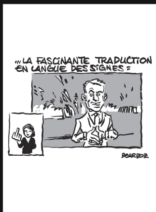
Trophée catégorie Professionnels Bearboz, blog personnel, 02/01/2024