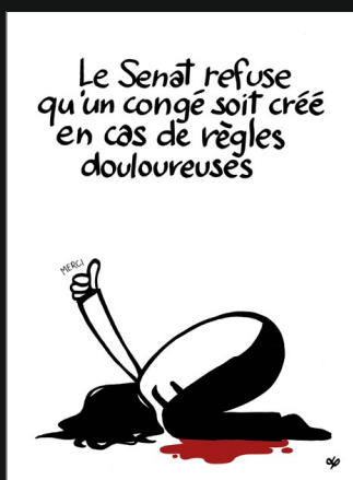
Trophée catégorie Étudiants Laure Ledoux, ESAC Cambrai