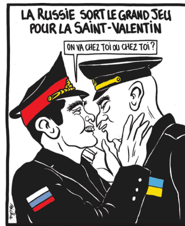
COUP DE CŒUR PROFESSIONNEL Biche, Charlie Hebdo , février 2022