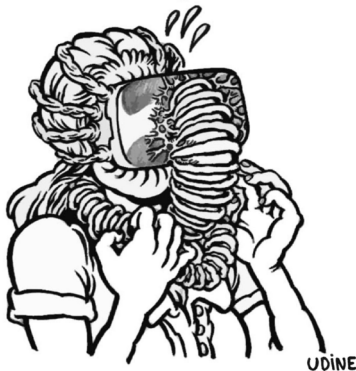
PRIX CHARLIE sur le thème « Demain, le métavers » Udine, MARGE, média dessiné