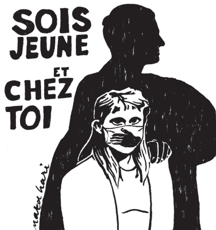
TROPHÉE PROFESSIONNEL Mata Hari, Siné Mensuel n° 104, février 2021